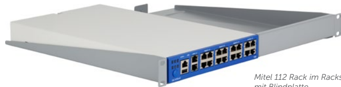
Mitel 112 Rack im Rackshelf mit Blindplatte

Die Mitel 100 für das All-IP-Netz, das Netz mit SIP Trunk als Standardzugang, ergänzt die bewährte OpenCom-100-Familie. Sie ist für alle Kunden, die für ihren Zugang zum öffentlichen Netz ausschließlich auf IP setzen und neben IP-Teilnehmern weiterhin analoge oder digitale Anschlüsse benötigen.